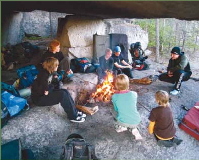
< Leirinuohtio tuo oikean tunnelman.