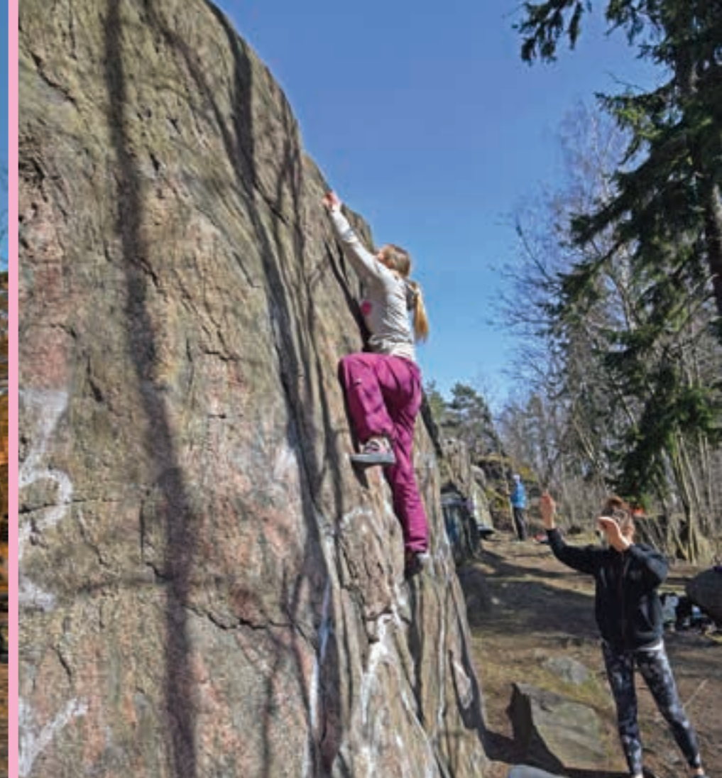
Keulamuuri on mukavan avoin ja hyvä paikka myös vasta-alkajille, Kuva: Jesse Saustamo