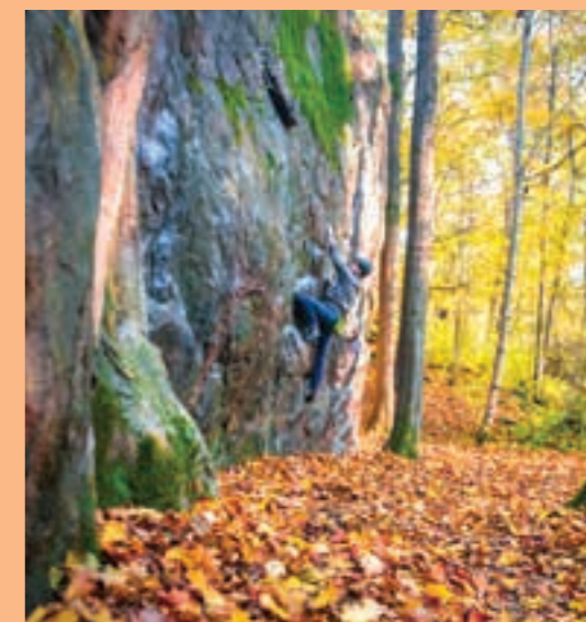
Meilahden seinälle mahtuu laatulinjoja pitkistä traverseista pelottavan korkeisiin highball-reitteihin

Lähestyminen: Helppo ja kaunis pyöräilymatka keskustasta Töölön rantoja pitkin. Bussilla 24 pääsee hyvin lähelle. Auto on hieman hankalampi, sillä tien varteen ei autoa saa jättää. Parkkipaikkoja löytyy pienen matkan päästä Oksakoskenpolun parkkikselta ja Seurasaaren päästä. + huomio: Huomaathan, että Right-sektorin päässä on asutusta. Vältäähän siis meluamista!